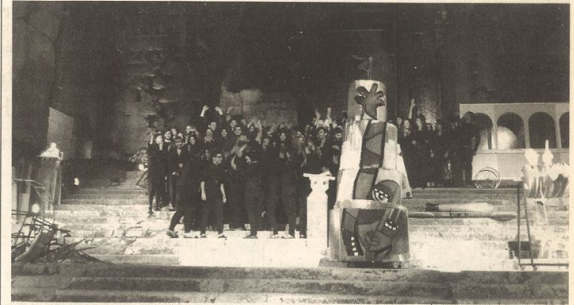
Une vue du spectacle.

Ballet Les étudiants de l'ALBA ont proposé samedi un ballet inspiré de l'œuvre littéraire de Jean Cocteau à l'occasion de leur spectacle de fin d'année, présenté, comme chaque fois, à Baalbeck. Un avant-goût du festival.