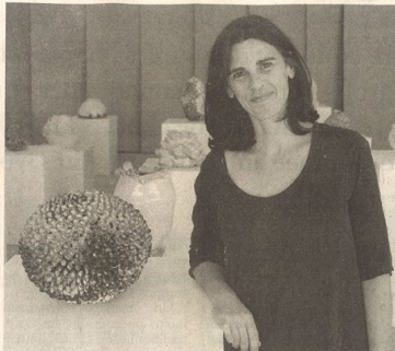
La céramiste en son jardin...